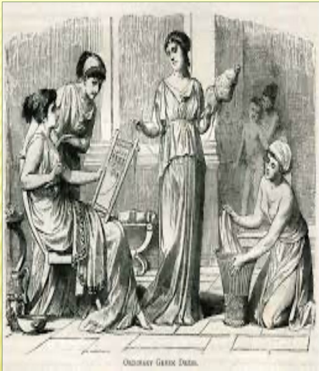
ORDINARY GREEK INTERIOR.